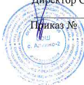
График приема пищи обучающимися СОШ с.Алкино-2